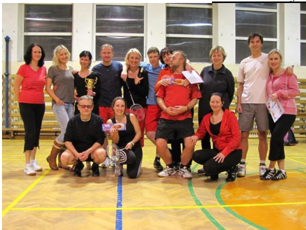
Vánoční turnaj v badmintonu 2014.